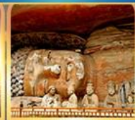
พาศินพระแกะสลักต้าจู๋