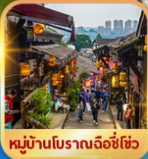
หมู่บ้านโบราณฉือซีโจว