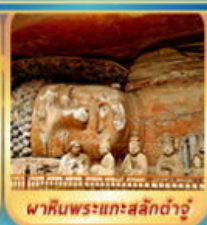
พาศิวพระแกะสลักต้าจู่