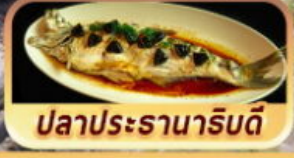
ปลาประจานาริบดี