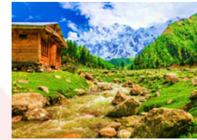
ยอดเขานั่งกาพาร์บัต

** พักที่ Raikot Sarai Hotel หรือเทียบเท่า **