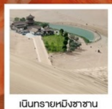
เป็นทรายหมิงซาซาน