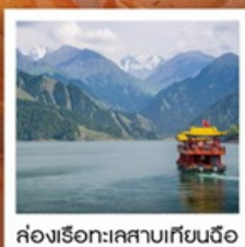
ช่องเรือทะเลสาบเทียนฉือ

เส้นทางสายไหม เริ่มต้นเพียง 53,999 FREE VISA