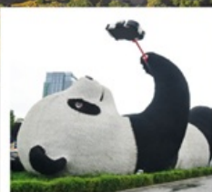
รูปปั้นแพนด้าเซลมี่