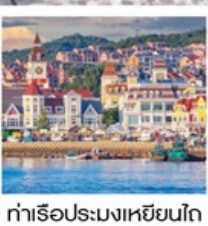
ท่าเรือประมงเขียนโก๋

เรือลิวส์ / ย่านฮั่นเล่อฟาง / ถนนฮั่วจวิปา ท่าเรือประมงเขียนโก๋ / ย่านฮองโหว่ 1920 / ถนนโบราณเฉาหยาง หอคอยกาลเวลา / ชายหาดจินซา / รูปปั้นปลาวาฬ / หาดทรายซาจื่อโฮ่ว หาดไซเบอร์ NO.3 / โรงงานเบียร์ชิงเต่า / โบสถ์ St. Emil ถนนคนเดินไต้ตง / สะพานจันเฉียว / จัตุรัส 54 / ห้าง MIXC