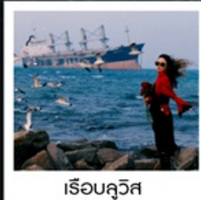
เรือลิวส์

หอคอยกาลเวลา / รูปปั้นปลาวาฬ / ถนนโบราณเตาหยาง / ย่านสงโขว่ 1920 / เมืองเว่ยไห่ / ถนนฮั่วจวีปา / จตุรัสประตู่แห่งความสุข ย่านอันลอฟาง / เรือลิวส์ / หาดซาจ้อฮั่ว / ถนนหลงเจียง / สะพานจันเจียว / หาดโซเบอร์ No. 3 ถนนจงซาน / โบสถ์ St.Emill / จตุรัส 54 / ศูนย์เรือใบโอลิมปิก / พิพิธภัณฑ์เบียร์ชิงเต่า / ถนนโตตง / ท่าเรือประมงเหียนโก