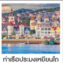
ท่าเรือประมงเหียนโก