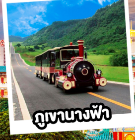
ภูเขาทางฟ้า