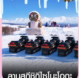
ลานสกีซึกิไซโนะโอกะ