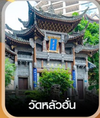
วัดหลิวอัน