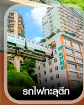
รถไฟทะเลตุ๊ก

✈️ คอนเฟิร์มออกเดินทาง ทุกพีเรียด 2 ท่านขึ้นไป