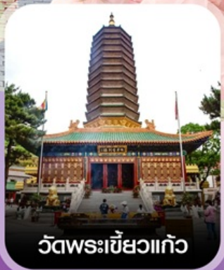
วัดพระเขี้ยวแก้ว