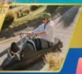
ดำหนอนเรื่องแฉง