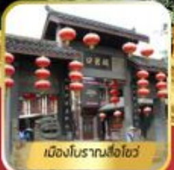
เมืองโบราณลือซื่อ