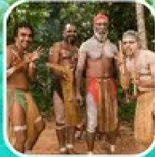
Rainforestation Aboriginal Show