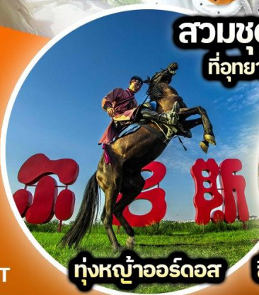
ทุ่งหญ้าออร์โดส

สวมชุดนักบินอวกาศ ที่อุทยานภูเขาไฟอูลันฮาตา