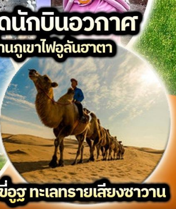
ขี่อูฐ ทะเลทรายเสียงซาวาน

📍 เช็ควินโฮโลโก้เด็ด 🛒 น้ำหนักกระเป๋า 20 KG 🏨 พักโรงแรม 4 ดาว