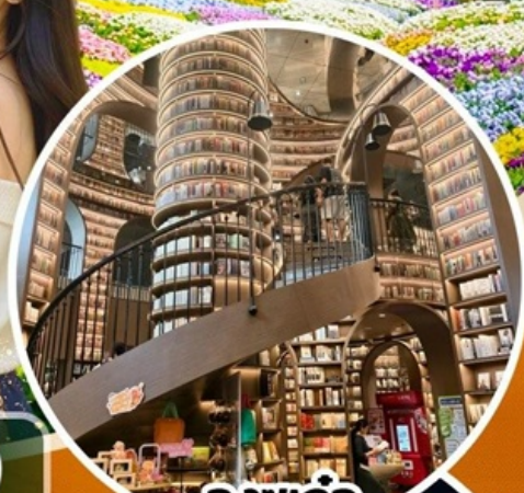
จางชู่เก๋อ