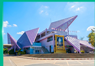
ด่านพรมแดนช่องเม็ก