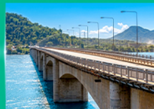
สะพานมิตรภาพลาว - ญี่ปุ่น