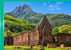
ปราสาทหินวัดพู