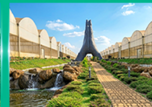
Agro Vege Farm