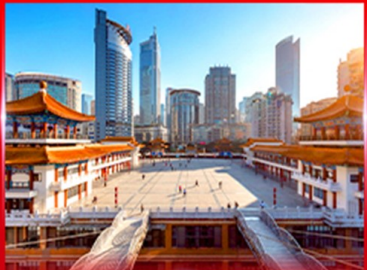
เซ็คอิน ตึกโควซิงโห

OPTION ซีตี้ทัวร์ธงจีน ชมแฟชั่นด้า, POPMART, ซือเป่มีง, ถนนคนเดิน