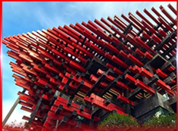
แลนด์มาร์คคิง ตึกตะเกียบ