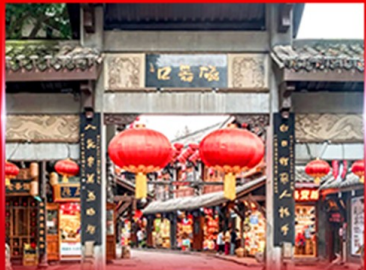
หมู่บ้านโบราณฉิวซีโหว่