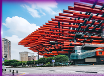
แลนด์มาร์กจิ่ง ตึกตะเกียบ