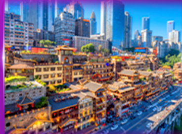
เข็ควินย่านต้ง หงหยาดัง