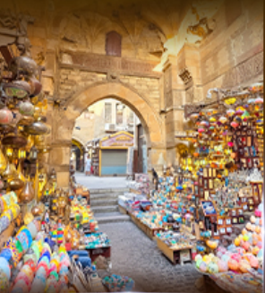
ตลาดห่านเอลคาลิ