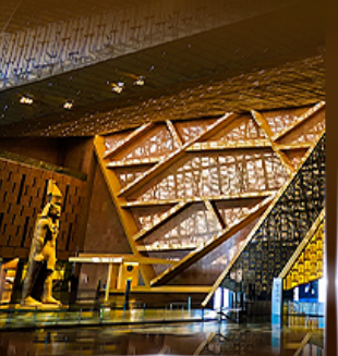
พิพิธภัณฑ์แกรนด์อียิปต์ (GEM)