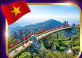
สะพานมือสีทอง ฮอยอัน