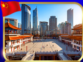
ตึกไค่ว์ซิงโหล