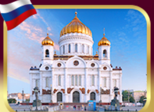
มหาวิหารเซนต์ซาวีร์