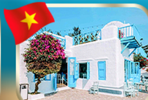
คาเฟ่สไตล์ชาโตริมี ชั้นตรา เมารี่