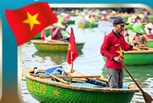
ล่องเรือกระด้ง ชมหมู่บ้านกัททัน