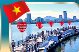
เช็คอินสะพานแห่งความรัก ดานัง