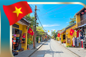
เที่ยวชมเมืองเก่ามรดกโลก ฮอยอัน