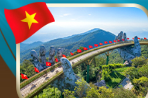
เที่ยวสะพานบ็อกกวงคำ บานาฮิลล์