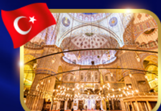
ชมความงามสุเหร่าสีน้ำเงิน