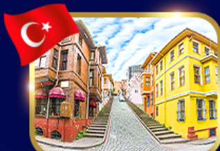
ชมบ้านหลากสี ย่านบาลีก