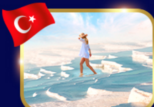
ปราสาทปุยฝ้าย ปามุคคาเล่