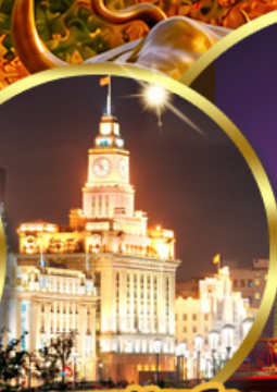
เดอะแลนด์