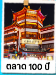
ตลาด 100 ปี