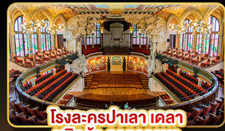
โรงละครปาเลา เดลา มูสิกา คาทาลานา