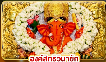
องค์สิทธินายัก