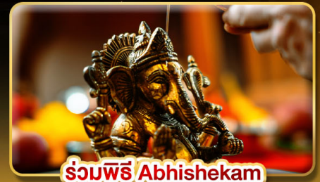
ร่วมพิธี Abhishekam