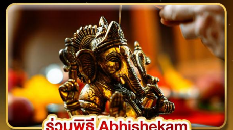
ร่วมพิธี Abhishekam