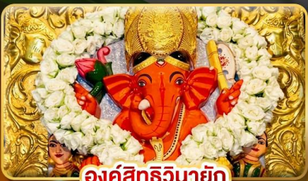
องค์สิทธินายัก