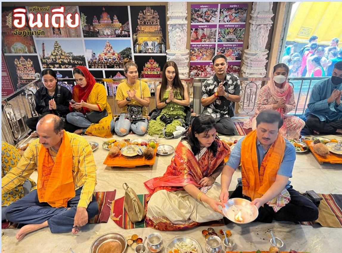
พิเศษ!!! ร่วมพิธี Abhishekam ที่ Dagdusheth Temple