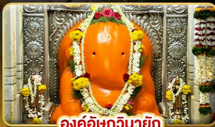
องค์อชฏินายัก