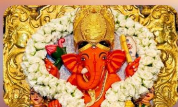
องค์สิทธิวินายัก