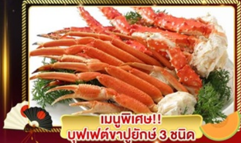
เมนูพิเศษ!! บุฟเฟ่ต์ขาปูยักษ์ 3 ชนิด