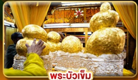
พระบิวเข้ม