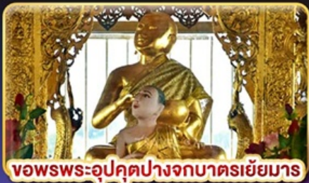
ขอพรพระอุปคุตปางจากบาตรเยี่ยมมาร