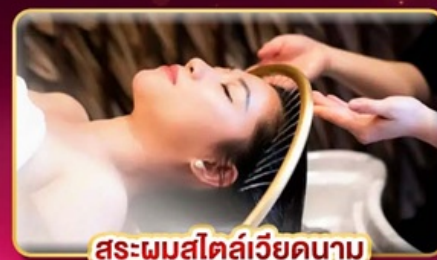
สระผมสไตล์เวียดนาม