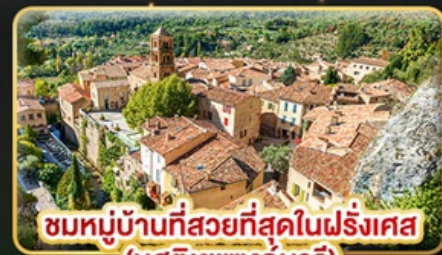
ชมหมู่บ้านที่สวยงามที่สุดในฝรั่งเศส (มูสติเยแซงก์มารี)