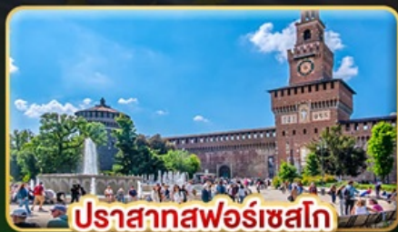
ปราสาทฟอรัสเซโก

📅 เดินทาง : 28 พ.ค. - 06 มิ.ย. | 05-14 ส.ค. 15-24 ต.ค. 69