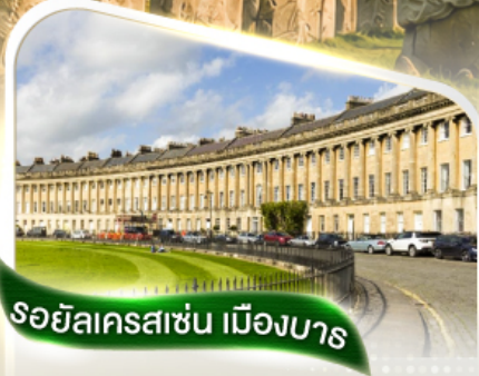
รอยัลคราสซัน เมืองบาร