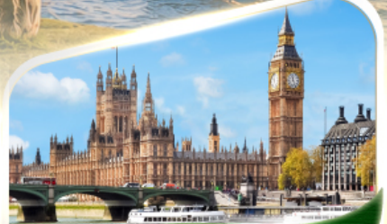
หอนาฬิกาบิ๊กเบน