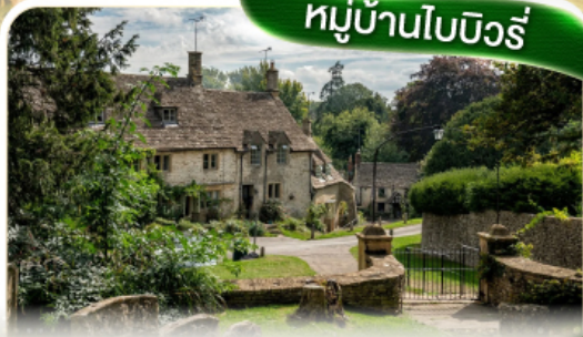
หมู่บ้านโบนิวรี่