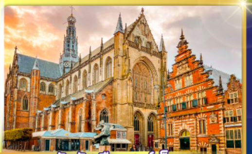
จัตุรัสเมืองฮาร์เล็ม

พรมแดนเมืองเนเธอร์แลนด์และเบลเยียม เคนเมืองเคลฟท์ เมืองเครื่องปั้นดินเผาระดับโลก ฮาร์เล็มเมืองมั่งคั่งที่สุดของเนเธอร์แลนด์