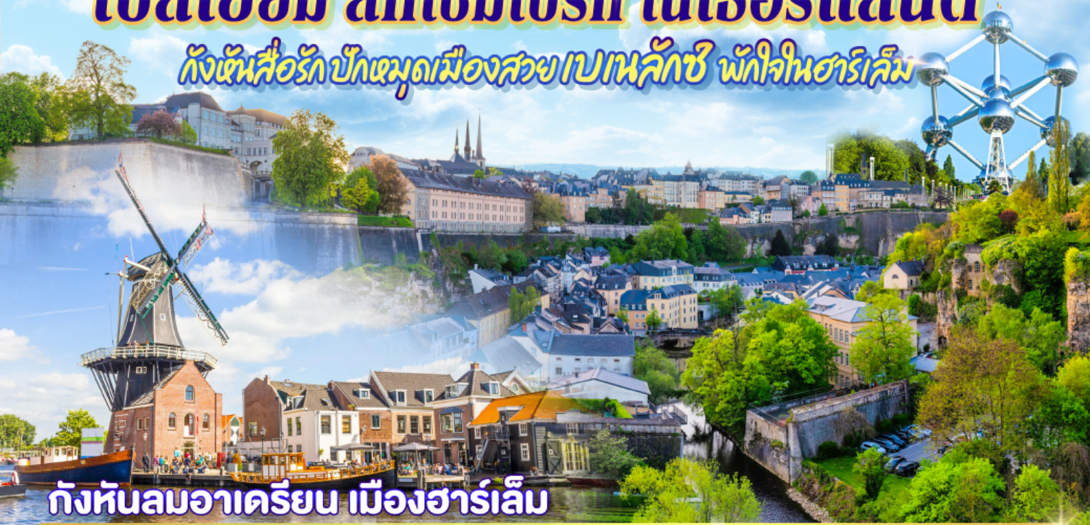
กังหันลมอาครियิน เมืองฮาร์เล็ม