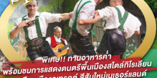
พิเศษ!! ทานอาหารค่ำ พร้อมชมการแสดงดนตรีพื้นเมืองสไตส์ทีโรเลียน และเยือนเมืองอูเทรคต์ สีสันใหม่เนเธอร์แลนด์

ไฮไลท์โปรแกรม • เยือนเมืองแห่งแคว้นบาวาเรีย และ ทีโรล • สุกสนานเหมืองเกลือเบิร์ชเทสกาเดิน • เข้าชมปราสาทนอยชวานสไตน์ • เดินเล่นจัตุรัสโรเมอร์ ซอปปิง Zeil Street • ถ่ายรูปมุมสวยของหมู่บ้านอัลสติก • ซิลลา ไปในเมืองซาลสบูร์ก บ้านเกิดโมสาร์ท 25 ก.ย. - 04 ต.ค. 69 • ล่องเรือหมู่บ้านทีธูร์น และ ล่องเรือชมนครอัมสเตอร์ดัม 09-18, 16-25 ต.ค. 69 • ซอปปิงจุ้ย่านดิมสแควร์และเดินเล่นย่านโคมแดง 22-31 ต.ค. 69 / 06-15 พ.ย. 69 GO3MUC-TG032 29 ธ.ค. 69 - 07 ม.ค. 70 * ปีใหม่ * 95,900.- ราคาเริ่มต้น