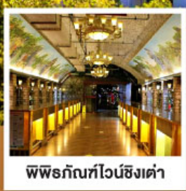
พิพิธภัณฑ์ไวน์ชิงต้า