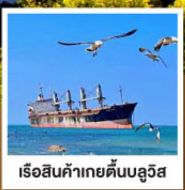
เรือสินค้าเกย์ตันบลูอิส