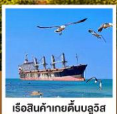
เรือสินค้าเกย์ตันบลูวิส