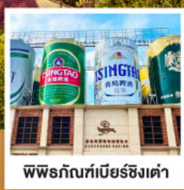
พิพิธภัณฑ์เบียร์ชิงต้า