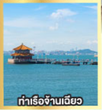
ทำเรือจ้างเฉียว