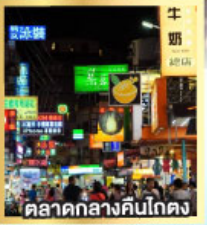
ตลาดกลางคืนโตง