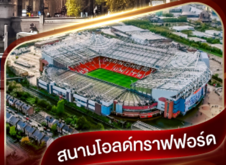
สนามโอลด์กราฟฟอร์ด