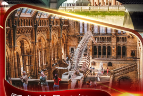
พิพิธภัณฑ์ประวัติศาสตร์ธรรมชาติ ลอนดอน