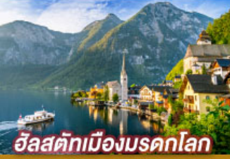
อิลสต์ เมืองมรดกโลก