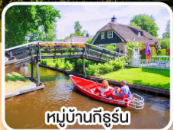
หมู่บ้านทึร์รัน