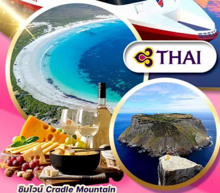
ซินิวน์ Cradle Mountain