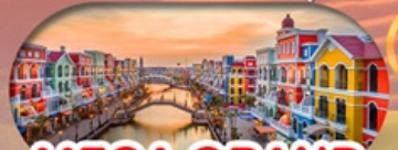
MEGA GRAND WORLD HANOI แลนด์มาร์คแห่งใหม่