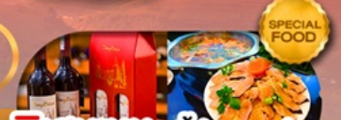
พิเศษเมนู สุกี้ปลาเซลม่อน ลิ้มรสไวน์แดงชื่อดัง เดินทาง ต.ค. 69 เป็นต้นไป