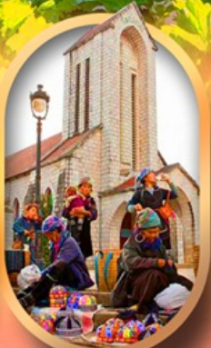
โบสถ์หินซาปา