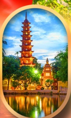
วัดเงินท็อก