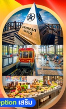
Option เสริม Fansipan