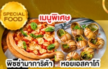
พิซซ่ามาริตต้า หอยแอสคาโก้