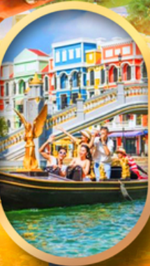
เอนิเมชั่นเวียดนาม