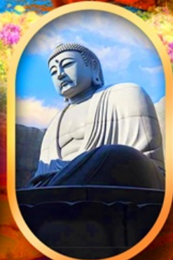
เบ็นเนาแห่งพระพุทธรเจ้า