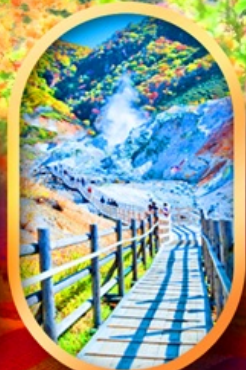
หุบเขานรกจิกุคุดานิ