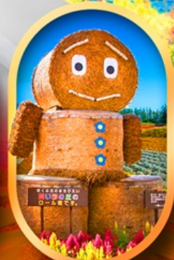
ซิกิโซ โนะโอะกะ