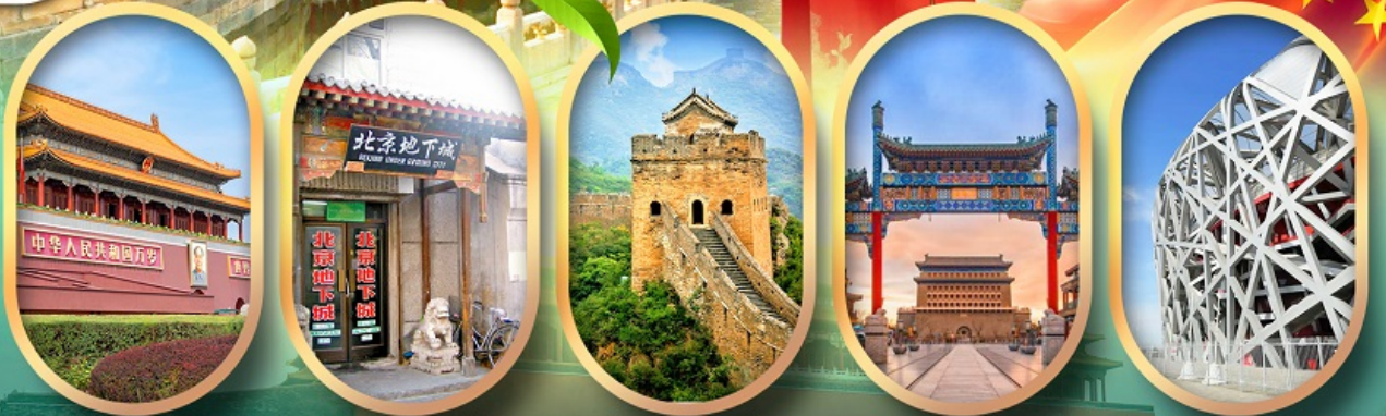
จัสมตรีสเทียนอันเหมิน เมืองโบราณใต้ดิน กำแพงเมืองจีน ถนนคนเดินเทียนเหมิน ผ่านชมสนามกีฬาฟาริงก