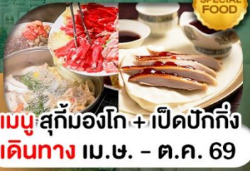
เมนูสุกั้มองโก + เปิดปักกิ่ง เดินทาง เม.ษ. - ต.ค. 69