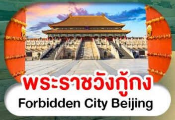
พระราชวังกู้กง Forbidden City Beijing