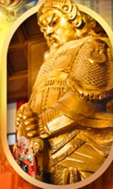
ทองพระวัดแชกง

เที่ยว 2 ประเทศ ทองพระ วัดดัง ช้อปปิ้งจุใจ