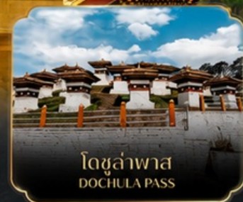
โดจุลาพาส DOCHULA PASS