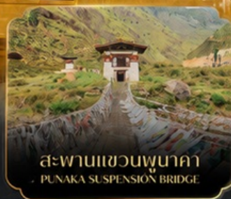
สะพานแขวนพุนาคา PUNAKA SUSPENSION BRIDGE