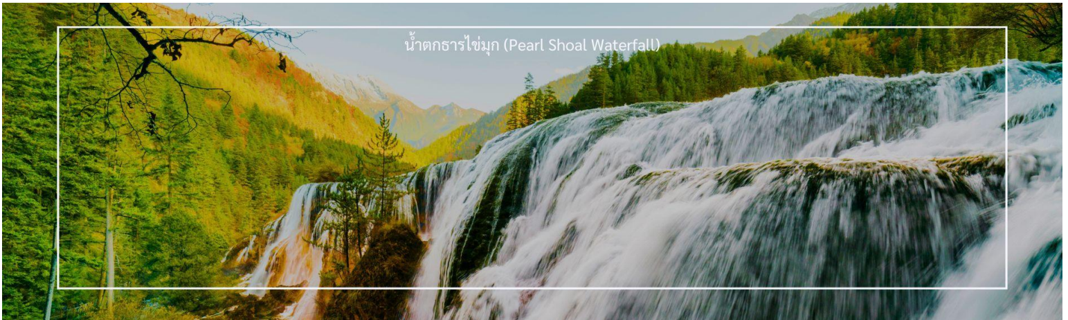
น้ำตกธารไข่มุก (Pearl Shoal Waterfall)

ชื่อของน้ำตกแห่งนี้มาจากรูปร่างของน้ำตกที่ไหลลงมาเป็นชั้นๆ คล้ายสายไข่มุกที่เปล่งประกาย น้ำตก Pearl Shoal เป็นน้ำตกที่ใหญ่ที่สุดในอุทยานแห่งชาติจิว่จ้ายโกว มีรูปร่างคล้ายพัด กว้าง 160 เมตร สูงจากระดับน้ำทะเล 2,433 เมตร น้ำไหลลงมายาว 310 เมตร นอกจากนี้ยังเคยเป็นสถานที่ถ่ายทำภาพยนตร์เรื่อง Journey to the West อีกด้วย